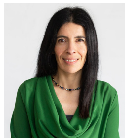
Rocio Cifuentes, Comisiynydd Plant Cymru

Mae Bwrdd Iechyd Prifysgol Caerdydd a'r Fro wedi bod yn weithgar wrth weithio tuag at ddull Y Ffordd lawn o ymgorffori hawliau plant i wasanaethau cyhoeddus ers sawl blwyddyn bellach. Mae'r cynllun strategol hwn yn gam allweddol i'w groesawu ar daith y Bwrdd i fod yn sefydliad blaenllaw sy'n hyrwyddo a pharchu hawliau plant. Rwy'n edrych ymlaen at weithio gyda'r Bwrdd Iechyd drwy gydol gweddill fy nhymor fel Comisiynydd i sicrhau bod plant yng Nghaerdydd a'r Fro yn gallu cael mynediad at eu hawliau i'r gofal iechyd gorau posibl, a lleisio eu barn ar faterion sy'n effeithio arnynt.