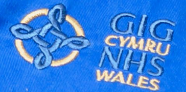
Tara Rees Nyrs y Flwyddyn RCN Cymru 2023